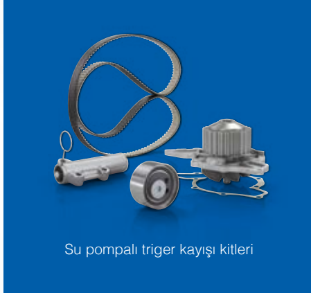
Su pompalı triger kayışı kitleri