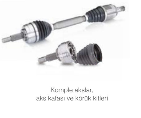
Komple akslar, aks kafası ve körük kitleri