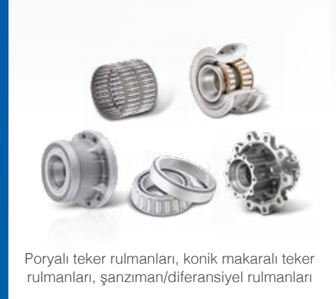
Poryalı teker rulmanları, konik makaralı teker rulmanları, şanzıman/diferansiyel rulmanları