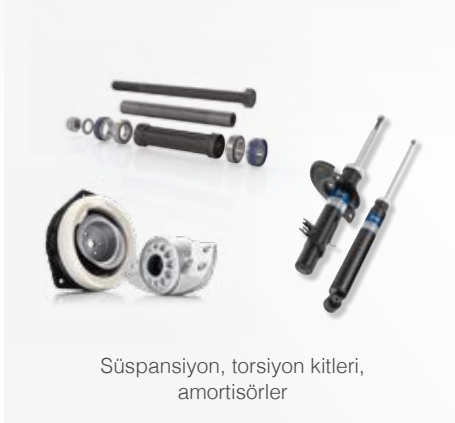
Süspansiyon, torsiyon kitleri, amortisörler