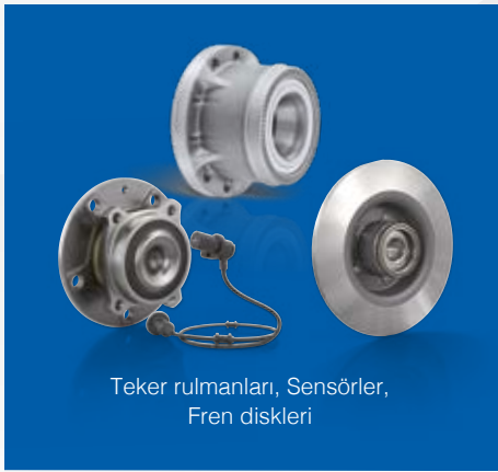
Teker rulmanları, Sensörler, Fren diskleri