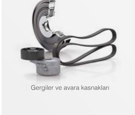
Gergiler ve avara kasnakları