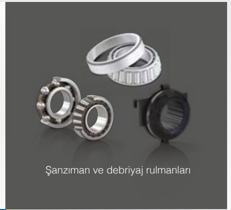
Şanzıman ve debriyaj rulmanları