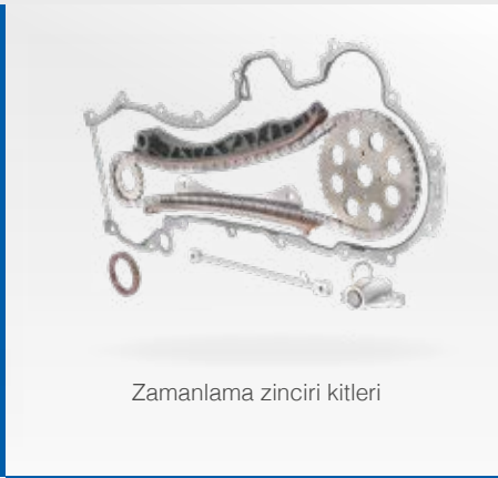
Zamanlama zinciri kitleri